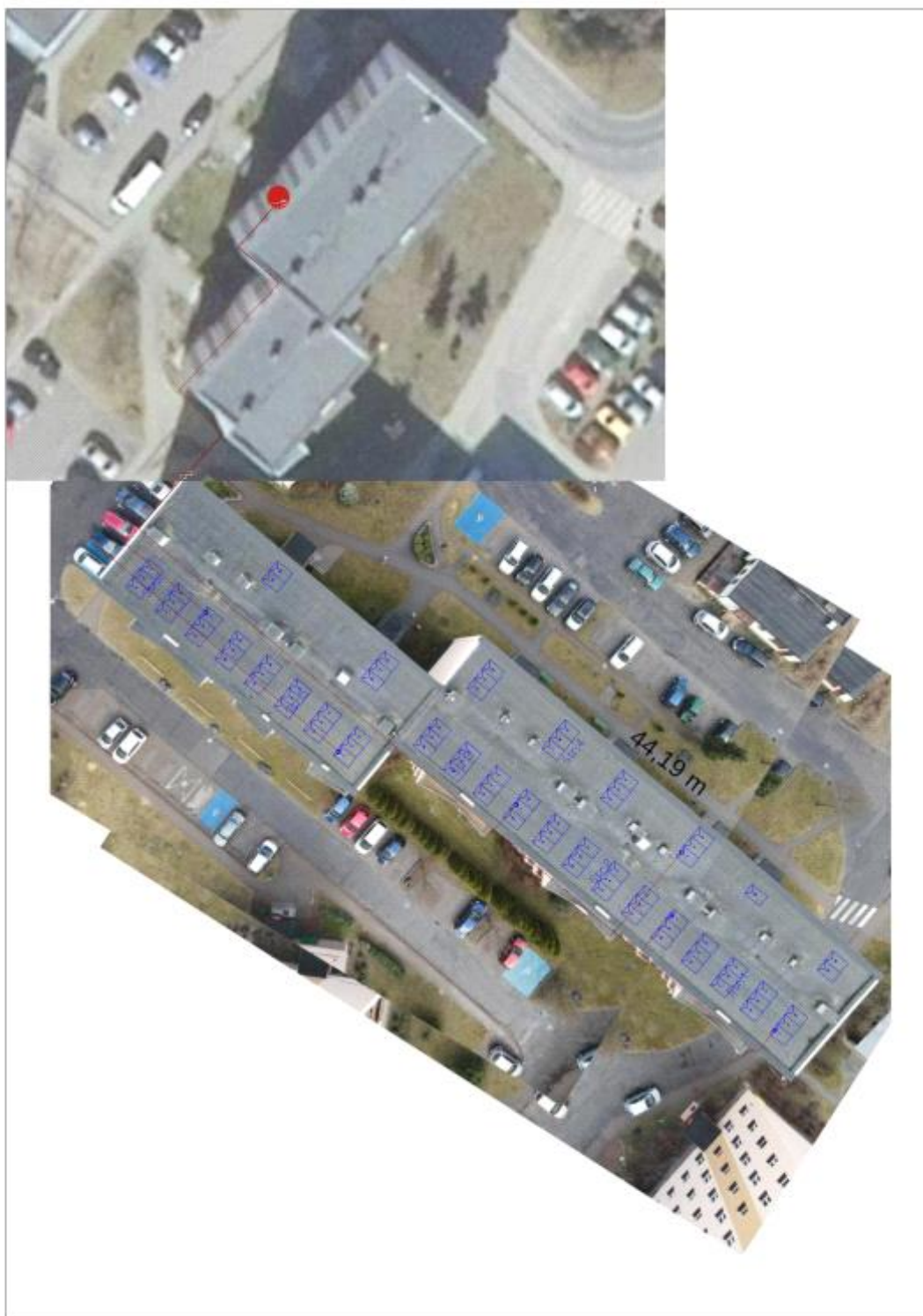
Figura 2: Umieszczenie generatora fotowoltaicznego i grupy konwersji